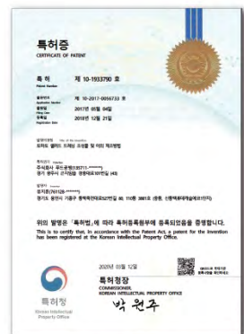
토마토 샐러드 드레싱