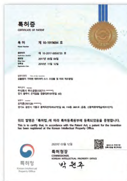
숯불 데리야끼 소스